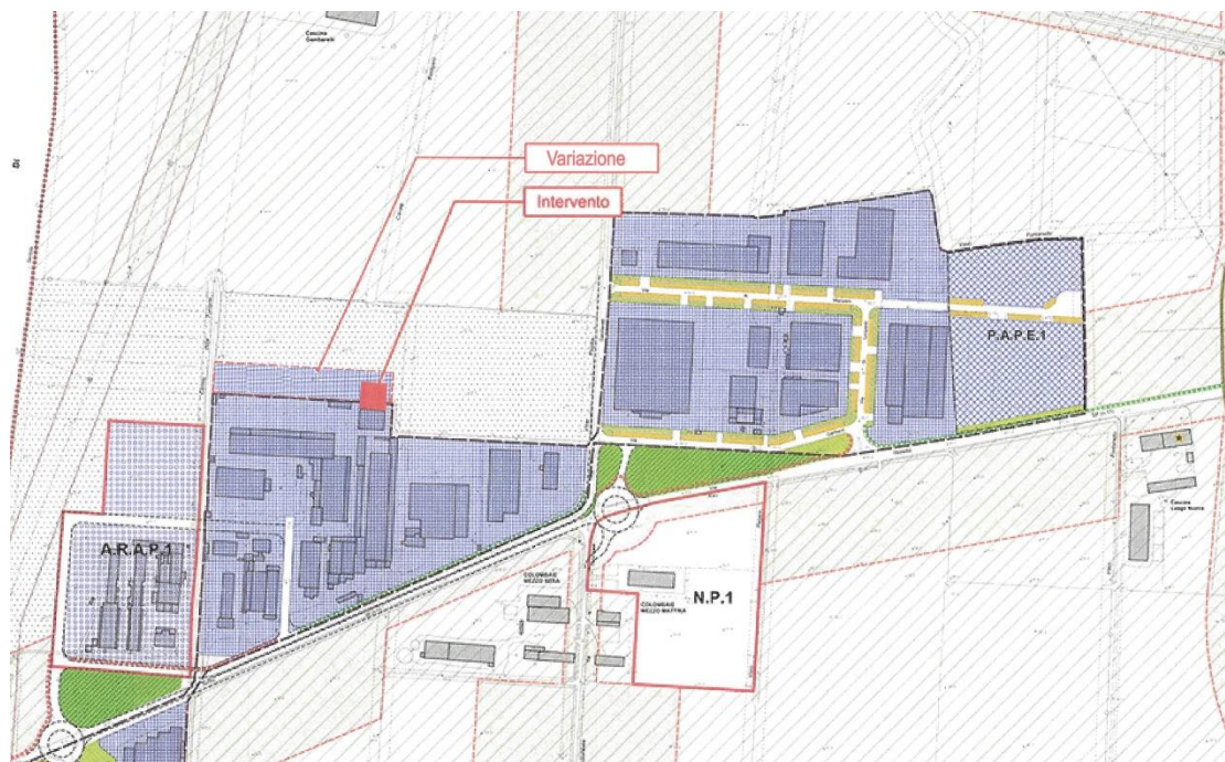
PIANO DELLE REGOLE P.G.T. IN VARIANTE